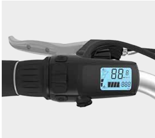
Het compacte LCD display is geïntegreerd in het handvat