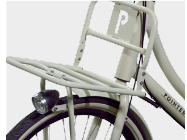
Handige brede voordrager mét Pointer's Safety Spring