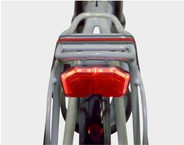
Het fraai vormgegeven achterlicht van de Arena